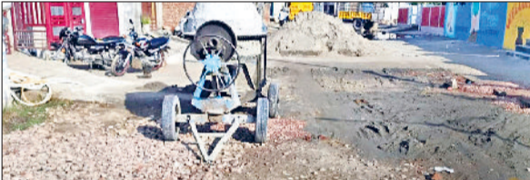
कलायत। आरसीसी से बनने वाली वह गली जिसको लेकर विवाद खड़ा हुआ।

कलायत में नेशनल हाई-वे रामगढ़ मोड़ से वीर शिरोमणि महाराणा प्रताप सामुदायिक भवन के पास से होते हुए खरक दरवाजा तक लाखों रुपए के बजट से बनने वाली गली में प्रयुक्त सामग्री पर विवाद खड़ा हो गया है। इस निर्माण कार्य के तुरंत प्रभाव से सैपल भरने की मांग एसोबी व शहरी स्थानीय निकाय विजिलेंस से की जा रही है। गुणवत्ता, लेवल व मजबूती से जुड़े पहलुओं में भारी लापरवाही का