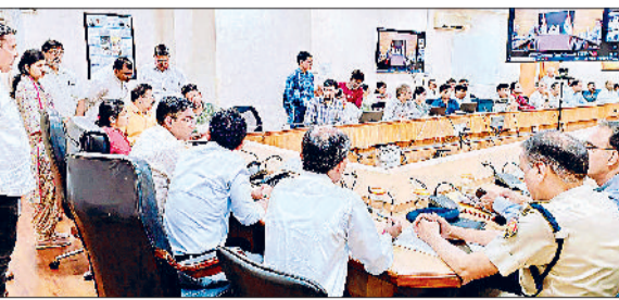
जीद। वीसी में भाग लेते अधिकारी।