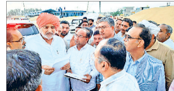
कृषि मंत्री ने लिया खरीद व्यवस्थाओं का जायजा