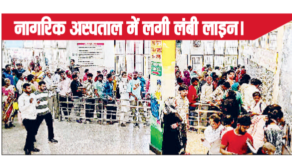
बुखार, सर्दी, जुकाम और खांसी की शिकायत लेकर मरीज बढ़ी संख्या में पहुंच रहे हैं। ज्यादातर मरीजों में हलका बुखार, गले में खराश,