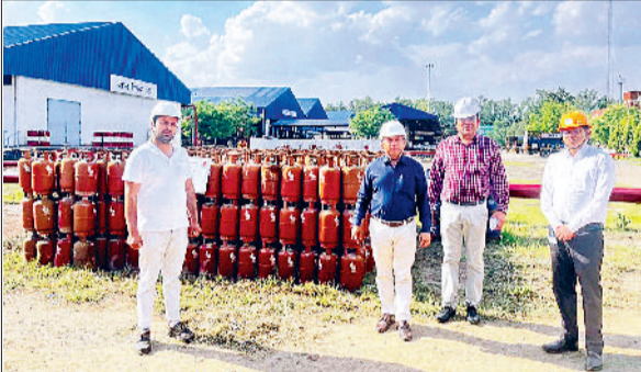
जींद। जींद पहुंचे छोटें पांच किलोग्राम के सिलेंडर।

मरीजों की लंबी कतारें लग जाती हैं। मौसम में बदलाव से महिलाएं, बच्चे और बुजुर्ग सभी प्रभावित हैं।