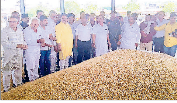
जीद। फसल खरीद का जायजा लेते डिट्टी स्पीकर डा. कृष्ण मिड्डा।

सुनिश्चित करने के लिए योजनाओं को व्यापक रूप से ऑनलाइन किया है। उन्होंने आगे कहा कि पहले के समय में लोगों को अपनी छोटी-छोटी समस्याओं के समाधान के लिए सरकारी कार्यालयों के बार-बार चक्कर लगाने पड़ते थे जिससे समय और संसाधनों की बर्बादी होती थी लेकिन अब डिजिटल सेवाओं के विस्तार के कारण अधिकतर सरकारी प्रक्रियाएँ सरल-पारदर्शी और सुलभ हो गई हैं। आमजन अब घर बैठे ही विभिन्न योजनाओं के लिए आवेदन कर सकते हैं और उनकी स्थिति की जानकारी भी ऑनलाइन प्राप्त कर सकते हैं। जनता दरबार