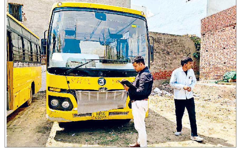
जींद। बसों की जांच करते परिवहन विभाग के कर्मचारियों।

वहीं 26 मार्च को रामनवमी पर राजकीय अवकाश था। वहीं 19 मार्च को चलाए गए अभियान के दौरान दो स्कूलों में 27 बसों की जांच की गई थी। जिस दौरान सभी मानक पूरे मिलने पर कोई चालान नहीं किया गया। वहीं 12 मार्च को