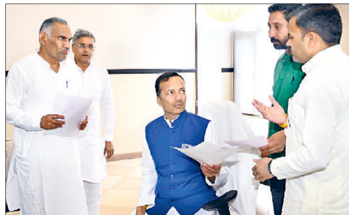
कैथल। सांसद नवीन जिंदल अपने कार्यालय में लोगों की शिकायतें सुनते हुए।

जनसेवा को प्राथमिकता देते हुए सांसद नवीन जिन्दल ने वीरवार को अपने कार्यालय में कार्यकर्ताओं एवं क्षेत्र से आए लोगों से मुलाकात की और उनकी समस्याओं को गंभीरता से सुना। इस अवसर पर जिले के विभिन्न गांवों और शहरों से पहुंचे लोगों ने अपनी-अपनी समस्याएं सांसद के समक्ष रखीं और उनके शीघ्र समाधान की अपेक्षा जताईं। मुलाकात के दौरान सांसद नवीन जिन्दल ने हर व्यक्ति की बात को धैर्यपूर्वक सुना और समस्याओं की गहराई को समझने का प्रयास किया। उन्होंने यह स्पष्ट किया कि जनता की समस्याओं का समाधान हमारी प्राथमिक जिम्मेदारी है और इसमें किसी भी प्रकार की प्रशासनिक ढिलाई या लापरवाही बिल्कुल भी स्वीकार नहीं की जाएगी। सांसद ने अपनी टीम को निर्देश देते हुए कहा कि सभी